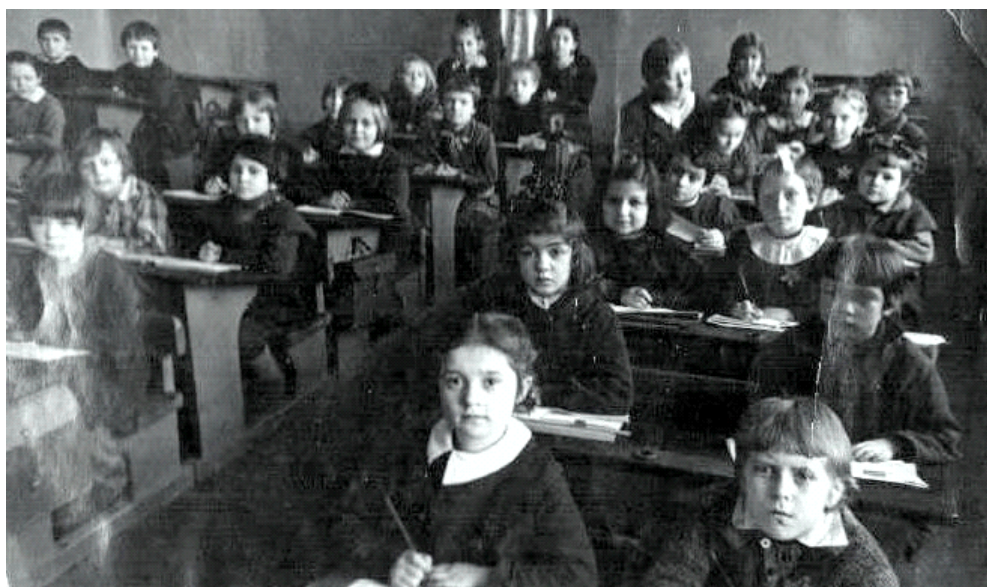
Я в первом классе

В Ленинград вернулись осенью 1944 г. Мама завербовалась рабочей, разбирать развалины разрушенных в блокаду домов. Война еще шла, в городе на открытых местах стояли зенитки. Всего не хватало. Да и жить пришлось первые 2 года у родственников, - квартира наша на улице Зодчего Росси сохранилась, но туда поселили людей из разбомбленного дома. Меня определила мама в ясли, брат пошел в 1-ый класс. Только через 2 года удалось получить комнатку на Петроградской стороне (15 кв. м.), где мы и жили втроем два десятка лет, где я успела кончить школу.