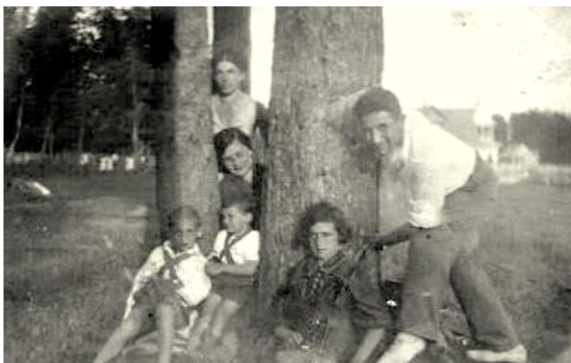
За несколько дней до войны. Мой брат с мамой и папой.

В это время мама была мной беременна и очень тяжело пережила эту трагедию.