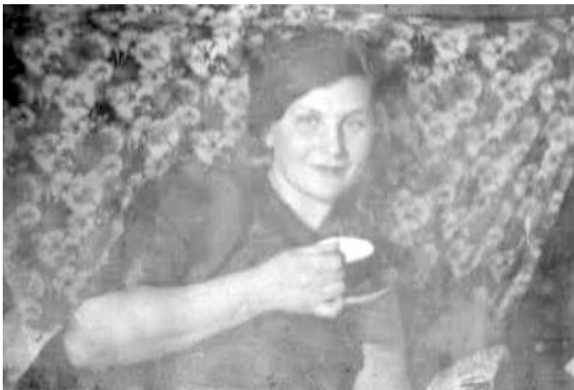
Мама перед войной