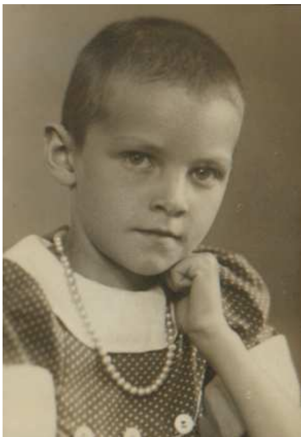
Вот эта фотография бритоголовой семилетней девочки, снятая в июле 1941г.

Из Боровичей меня спасла бабушка месяц спустя. В сводках говорилось, что немец шел так интенсивно, а Боровичи западнее Ленинграда, и бабашка бросила здесь все, никому ничего не сказав, кинулась за мной. Боровичи остались под немцем.