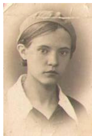
Это я 19 сентября 1937 год

Первым страшным симптомом войны стало сообщение о том, что у нас, на Суворовском около Смольного, бомба попала в академию, а туда только что привезли раненых. Мы все побежали туда, не знаю, было ли это желание помочь или бездумное любопытство... Весь дом горел, раненые погибали в огне, падали обгорелые вниз. Нет, это было не здание...это была сплошная дыра. Одного видела, не могу забыть, никогда не могла, и, наверное, уже не смогу: одна рука перевязана, а другой он держался за балку пятого этажа, а обгорелые тела всё