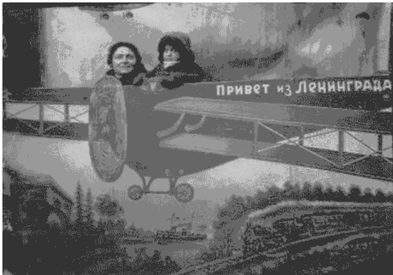
рисунок было 2 годика 4 месяца фотографировано мамой 18 октября 1939

Итак. Зимой меня привезли в Конюхово, а летом 1941 года мы оказались на оккупированной территории.