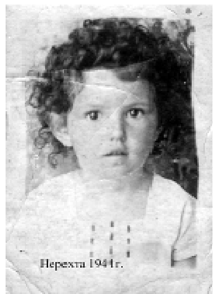
Переход 1941 г.