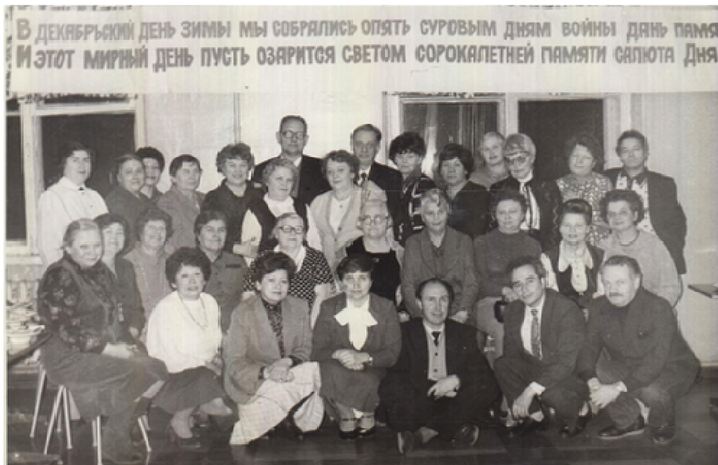
Встреча через 40 лет