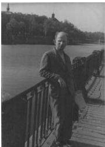
Лето 1942 года в блокадном Ленинграде