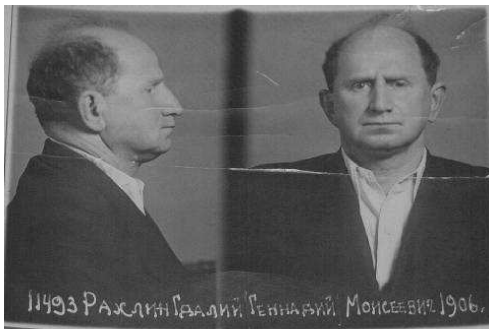
Фотография отца из дела