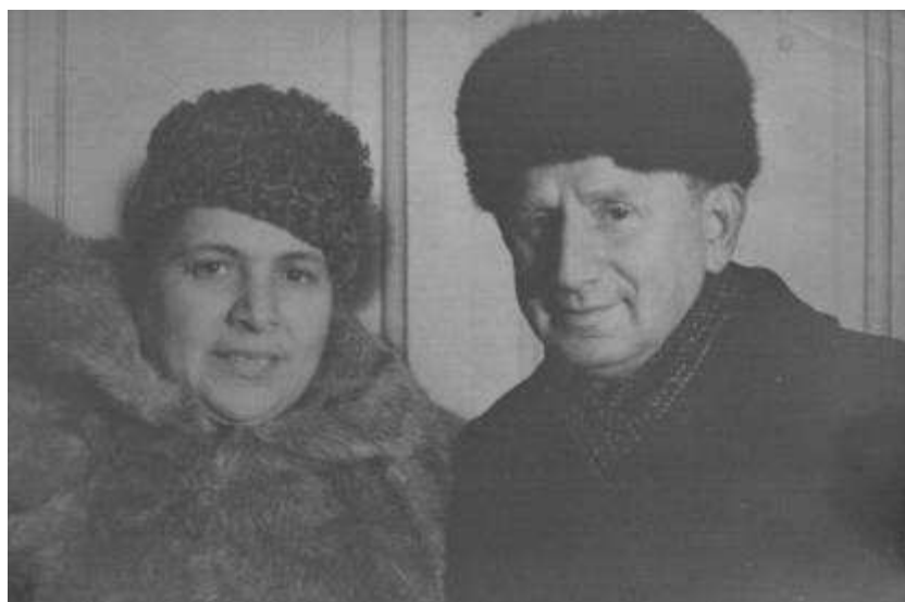
Родители после возвращения отца из лагеря