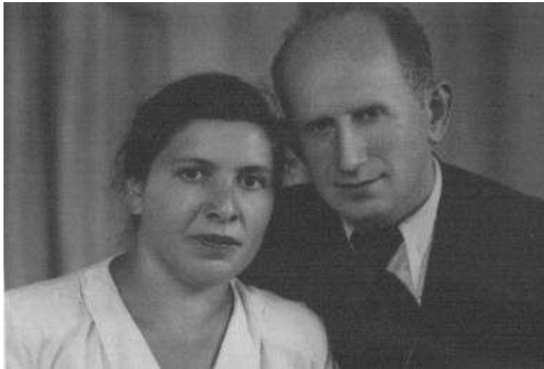
Мои родители, фотография военного времени (вероятно, 1943-1945)