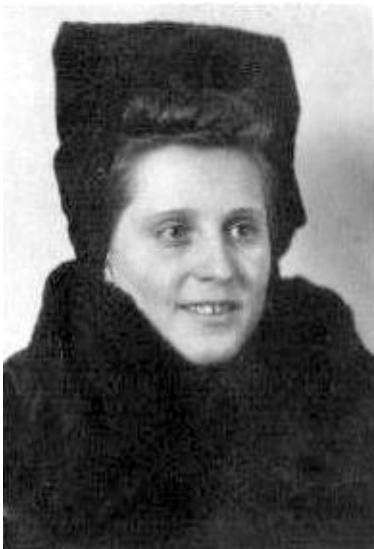
Это послевоенная фотография моей мамы.