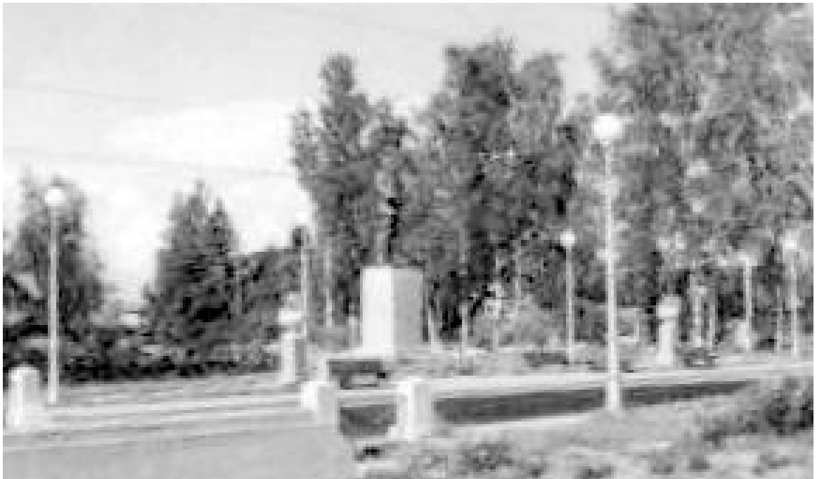
Памятник на Приморском шоссе перед ул.Ручейная

Тогда на Приморском шоссе перед ул. Ручейная стоял памятник, только не помню кому: Сталину или Ленину. На имеющемся фото также не разобрать. Впоследствии памятник куда-то исчез. Сейчас на этом месте расположилась одна из развязок кольцевой автодороги.