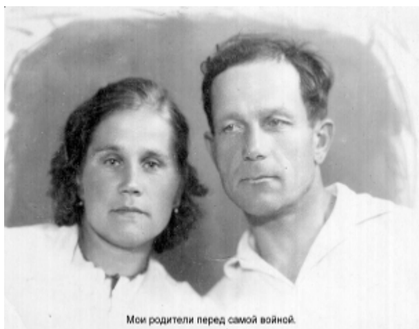
Мои родители перед самой войной.

Великая Отечественная война началась 22 июня 1941 года. Отца призвали в Армию. Мама осталась с двумя детьми: сыном 9 лет и мной 3,5 года. Через пару месяцев почти вся Псковская область и часть Ленинградской области (ныне Псковская) оказалась оккупированной немецкими войсками. Жили мы в деревне Дубско Ленинградской области. Мама работала председателем колхоза "Витянеж". Немецкие войска стремительно двигались к Ленинграду. На нашей территории везде создавались партизанские отряды. Мы находились в трёх км от районного центра села Ляды, которое находилось и находится по сей день на пути трассы ПЛЮССА-ГДОВ. В нашу деревню Дубско было два пути: 1) по глухому лесу 4 км и 2) окружная дорога от деревни Маленькое Голубско по перелеску 1 км. Вот с этой стороны немцы чаще всего и наведывались к нам. Поэтому круглые сутки (меняясь) стояли на страже мальчики, такие как мой брат и немного старше.