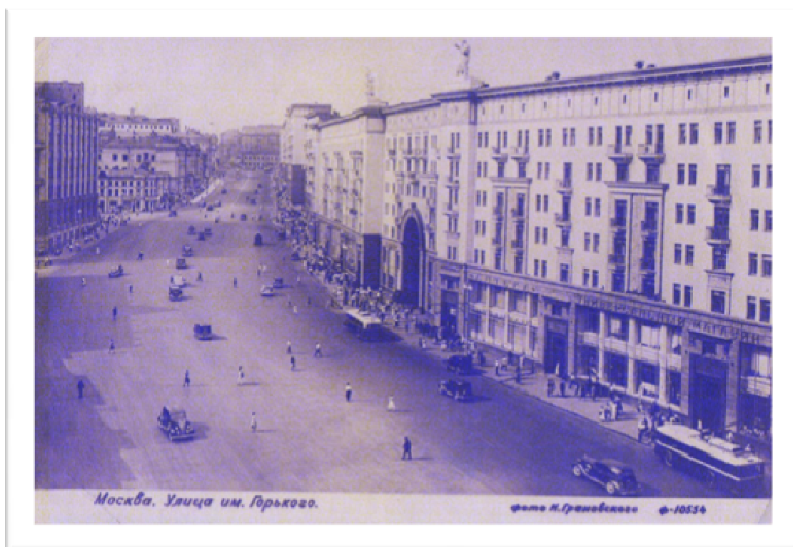
Открытка брата Юрия из Москвы.